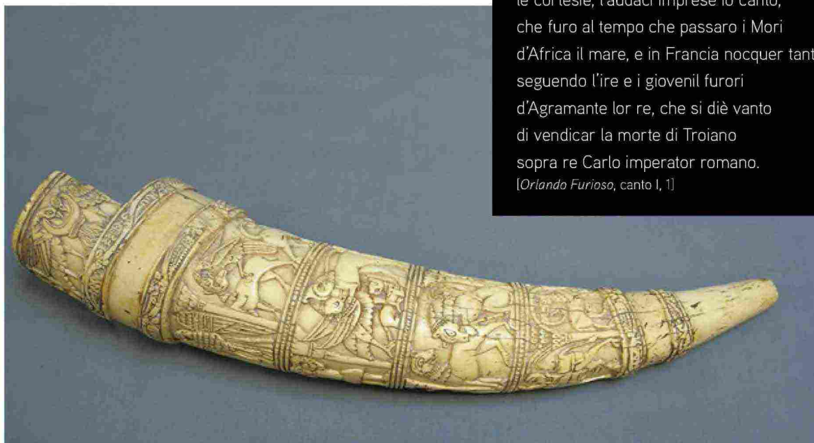
Oliante detto Corno d'Orlando (fine XI sec.) Avorio 52x13 cm Tolosa, Musée Paul-Dupuy

Le donne, i cavallier, l'arme, gli amori, le cortesie, l'audaci imprese io canto, che furo al tempo che passaro i Mori d'Africa il mare, e in Francia nocquer tanto, seguendo l'ire e i giovenil furori d'Agramante lor re, che si diè vanto di vendicar la morte di Troiano sopra re Carlo imperator romano. [ Orlando Furioso , canto I, 1]