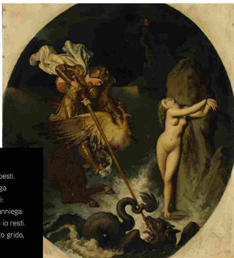
Jean Auguste Dominique Ingres Ruggiero libera Angelica (1841) Olio su tela 54x46 cm Montauban, Musée Ingres

La bella donna tuttavolta priega Ch'invan la dura squama oltre non pesti. Torna, per Dio, signor: prima mi slega (dicea piangendo), che l'orca si desti: Portami teco e in mezzo il mar mi anniega: Non far ch'in ventre al brutto pesce io resti. Ruggier, commosso dunque al giusto grido, Slegò la donna, e la levò dal lido. [Orlando Furioso, canto X, 111]