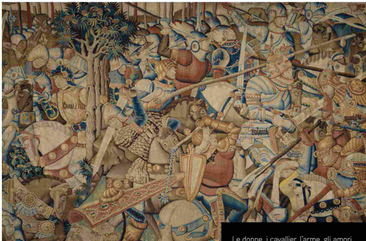
La battaglia di Roncisvalle (1475-1500 circa) Londra, Victoria and Albert Museum

Le donne, i cavallier, l'arme, gli amori, le cortesie, l'audaci imprese io canto, che furo al tempo che passaro i Mori d'Africa il mare, e in Francia nocquer tanto, seguendo l'ire e i giovenil furori d'Agramante lor re, che si diè vanto di vendicar la morte di Troiano sopra re Carlo imperator romano. [ Orlando Furioso , canto I, 1]